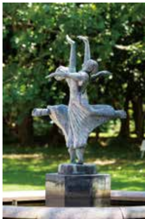
《躍動》清水多嘉示、彫刻 第3学生ホール前広場噴水(野外)