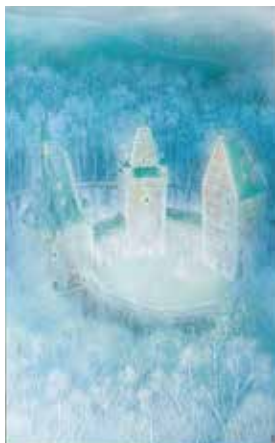
《白い森》渡邊美喜、日本画

透明感ある寒色系の色彩で幻想的な古城の世界を表現。ラウンジ入口に位置。点景となり室内外の空間をつなぐ。