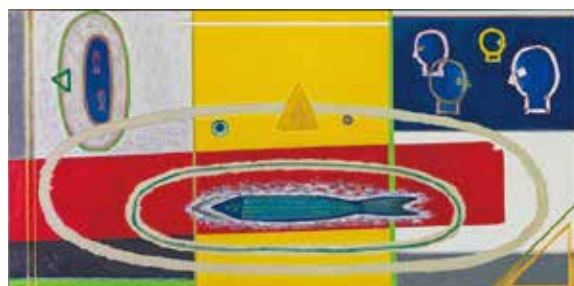
《顔と横切る赤》市橋太郎、油彩、体育・文化センター