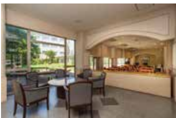
窓越しに《花鏡の庭》 (25号館中庭)を眺める