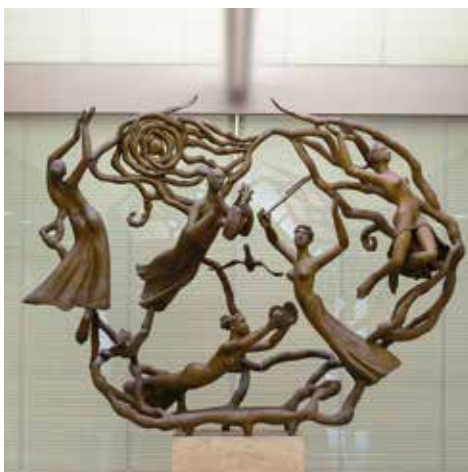
《宇宙への響き》 川原竜三郎、ブロンズ メモリアルホール