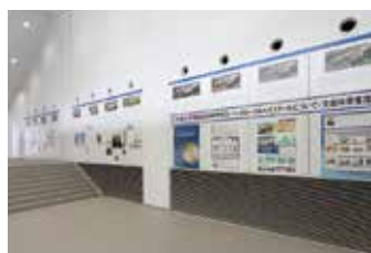
不言実行館ラウンジ風景