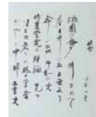
《中部大学校歌(自筆)(部分)》(書) 佐藤一英