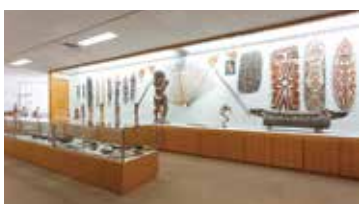
中部大学民族資料博物館 常設展示室(地域研究エリア)

世界文化遺産に登録されているアフガニスタンのバミヤン渓谷の古代遺跡群のうち、石窟寺院の今は無き西大仏内壁画の一部模写絵画。復元模写と並列して展示。