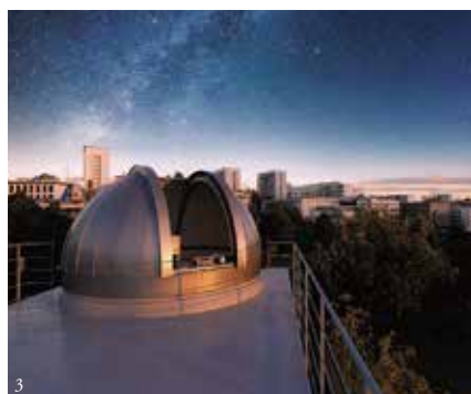
①9号館(池越しに眺める通学風景) ②25号館より(緑陰の広場と講義棟) ③天文台 天体観測所(夕陽に浮かぶ桃園の丘)