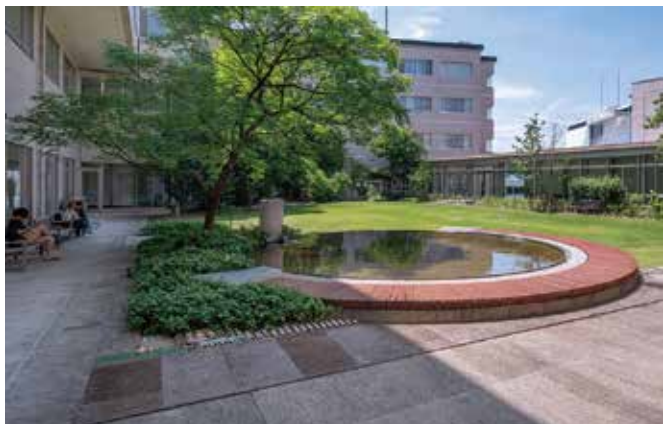
《花鏡の庭》(25号館中庭) 作庭：岡田憲久

芝生の広場に、直径7mの円形の池を設け、周囲に植生を配する。池には水鉢からわずかに水を落とす仕組みで、池底に敷かれた玉石と水面の波紋が、光と影、風によるリズムをひきたたせて感じさせる。