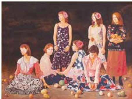
《大地の詩》金子亨、油彩・アクリル、25号館

内部は吹き抜けの空間で、東側の出入口の壁面には天井近くまである大きな窓を設けている。シャンデリアのような装飾的な照明の放つ雰囲気が潇洒である。一段下がった床面に、テーブルを囲む小空間があり、中庭に面した窓からも緑が映り鳥のさえずりが近くに響く。