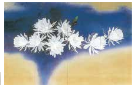
《宙(そら)》下川辰彦、日本画、71号館 群青と金色の空間に夏の一夜の花、月下美人を描いている。