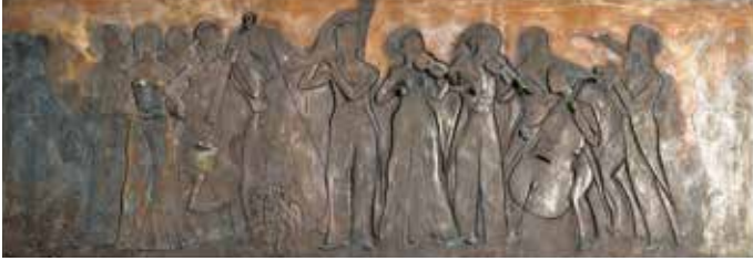
《ARMONIA》 川原竜三郎、ブロンズ 30号館

オーケストラの演奏風景が群像で表されている。30号館エントランス壁面に位置。エントランスの照明を控えめにし、建物西側のガラスからの採光によって通路の存在を示す効果がある。浮彫作品もこの静かな空間に溶け込んでいる。