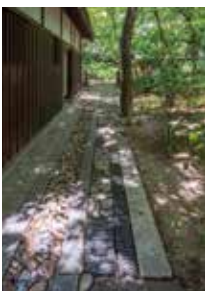
③書院建築(洞雲亭)と庭園