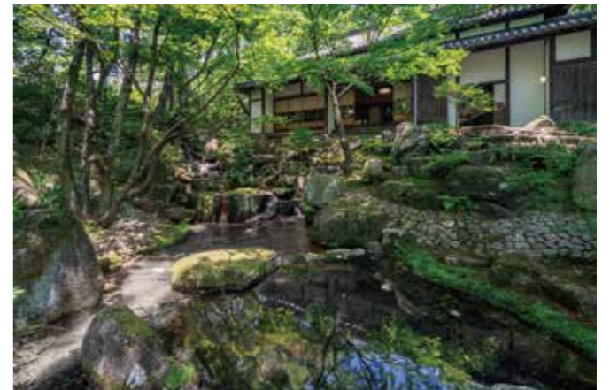
洞雲亭の書院建築と庭園