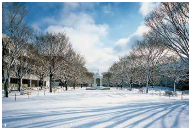
①潜龍池(霧水の朝) ②10号館南(紅梅) ③ロタンダのある広場(雪化粧)