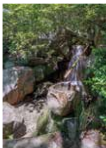
④工法庵・洞雲亭庭園の滝口の景