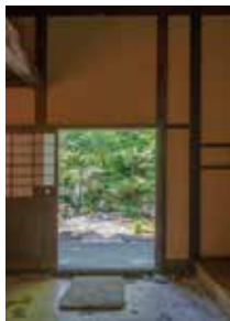
②洞雲亭からの眺め