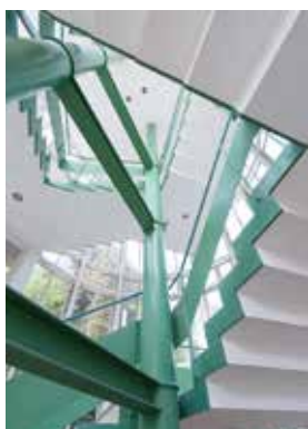
21号館階段 建築設計：株式会社第一工房 (代表 高橋誠一)