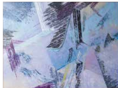
《XXX.COS.NAO.04》 新美哲也、油彩、10号館

薄紫とグレーを主調にした抽象表現。10号館南通路に位置。室内外の空間をつなぐ存在。