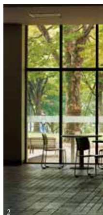
①潜龍池(紅葉に染まる天空と水辺) ②9号館ラウンジ(窓に映る樺並木) ③洞雲亭(書院)庭園(秋の景色)