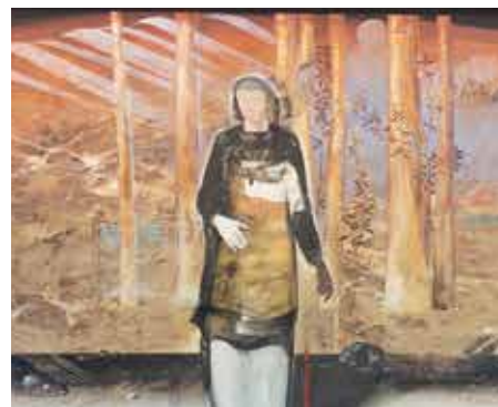
《風の棲家》「風の雫(詳細)」

光をテーマに人間本来の实在を問いかける四部作の大作。横に長く、南西がガラス張りとなっている50号館1階のラウンジの特徴に合わせて位置し、静かな空間を作りあげている。