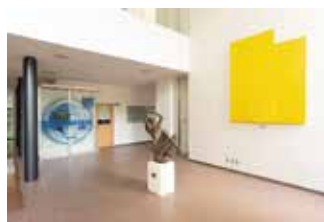
リサーチセンター内部

する美術家(市橋太郎[1940~])による平面作品がある。彫刻と絵画のコラボレーションによって、明るいリズムで調和された空間が生まれている。本学ではおよそ5点をオープンスペースに設置している。その他、1号館1階のアートギャラリーにて市橋太郎作品を複数展示している(P11参照)