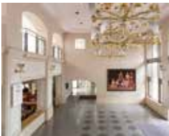
25号館ラウンジ風景

内部は吹き抜けの空間で、東側の出入口の壁面には天井近くまである大きな窓を設けている。シャンデリアのような装飾的な照明の放つ雰囲気が潇洒である。一段下がった床面に、テーブルを囲む小空間があり、中庭に面した窓からも緑が映り鳥のさえずりが近くに響く。