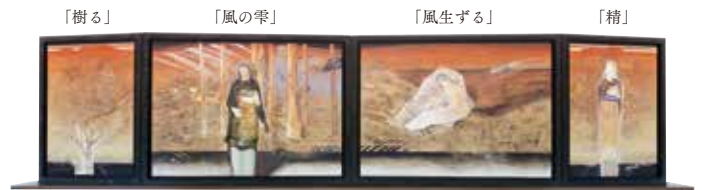
《風の棲家》平岡靖弘、油彩