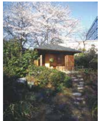
立礼式の茶席「爛柯軒」