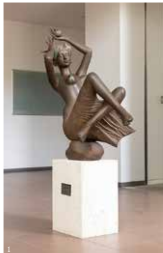
①《アドリアの抱き》川原竜三郎、ブロンズ、リサーチセンター ②《Yellow Paintings》市橋太郎、油彩、リサーチセンター

する美術家(市橋太郎[1940~])による平面作品がある。彫刻と絵画のコラボレーションによって、明るいリズムで調和された空間が生まれている。本学ではおよそ5点をオープンスペースに設置している。その他、1号館1階のアートギャラリーにて市橋太郎作品を複数展示している(P11参照)