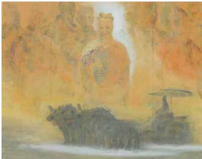
《西安追想—平和への巡幸》下川辰彦、和紙、顔料、墨、中部大学民族資料博物館