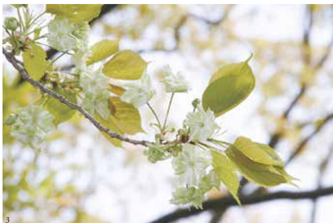
①体育館・講堂(入学式) ②2号館(枝垂れ桜) ③洞雲亭(書院)庭園(淡緑の桜、御衣黄(ぎょいこう))