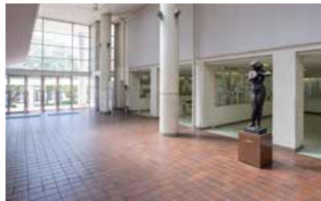
キャンパスプラザ内

学生の往来する吹き抜け空間中央にある。ガラス越しのため、やわらげられた陽光を受けておだやかな存在感を漂わせる。