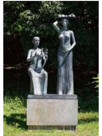
《太陽の詩》川原竜三郎 ブロンズ、10号館前 野外