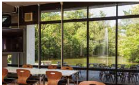
20号館ラウンジからの眺め

北面に池の景観、南面にレンガ敷きの広場が広がり、戸外の景観を部屋の内部にいながらにして感じることができる。